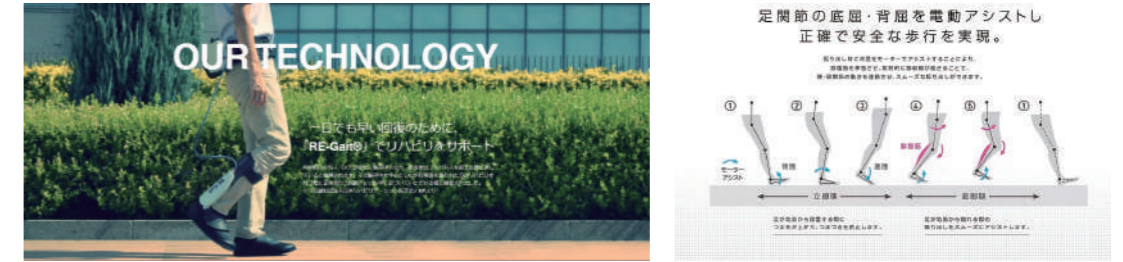
オリジン社のRE-Gait(リゲイト)

*「RE-Gait」は麻痺を改善したり、治すものではありません。 *効果には個人差があります。